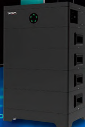
ΜΠΑΤΑΡΙΑ ΑΠΟΘΗΚΕΥΣΗΣ ΕΝΕΡΓΕΙΑΣ