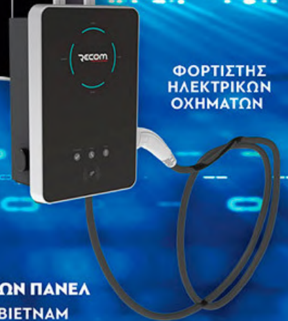
ΦΟΡΤΙΣΤΗΣ ΗΛΕΚΤΡΙΚΩΝ ΟΧΗΜΑΤΩΝ

ΚΟΡΥΦΑΙΑ ΜΑΡΚΑ & ΠΡΟΜΗΘΕΥΤΗΣ ΦΩΤΟΒΟΛΤΑΪΚΩΝ ΠΑΝΕΛ