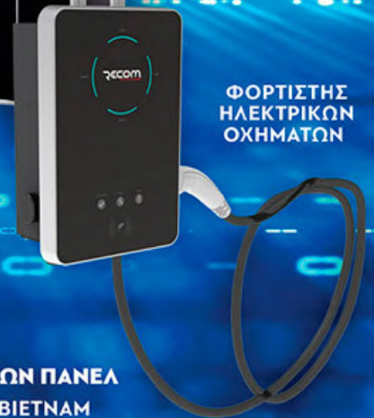
ΦΟΡΤΙΣΤΗΣ ΗΛΕΚΤΡΙΚΩΝ ΟΧΗΜΑΤΩΝ

ΚΟΡΥΦΑΙΑ ΜΑΡΚΑ & ΠΡΟΜΗΘΕΥΤΗΣ ΦΩΤΟΒΟΛΤΑΪΚΩΝ ΠΑΝΕΛ