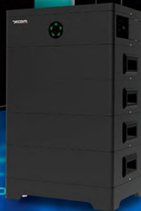
ΜΠΑΤΑΡΙΑ ΑΠΟΘΗΚΕΥΣΗΣ ΕΝΕΡΓΕΙΑΣ