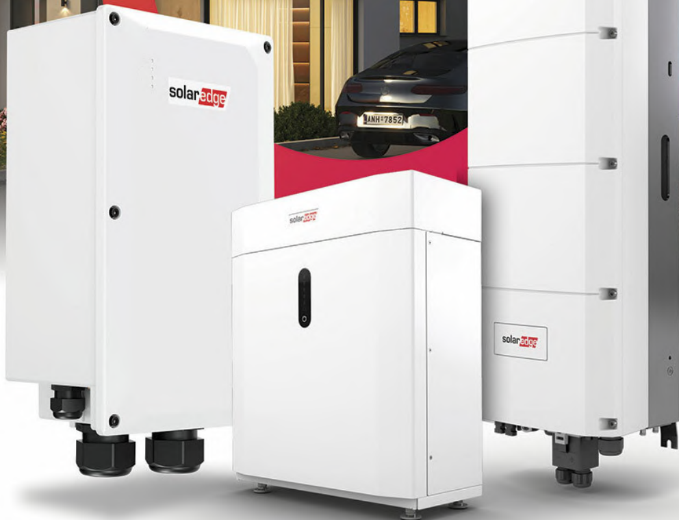
SolarEdge Home Backup Interface